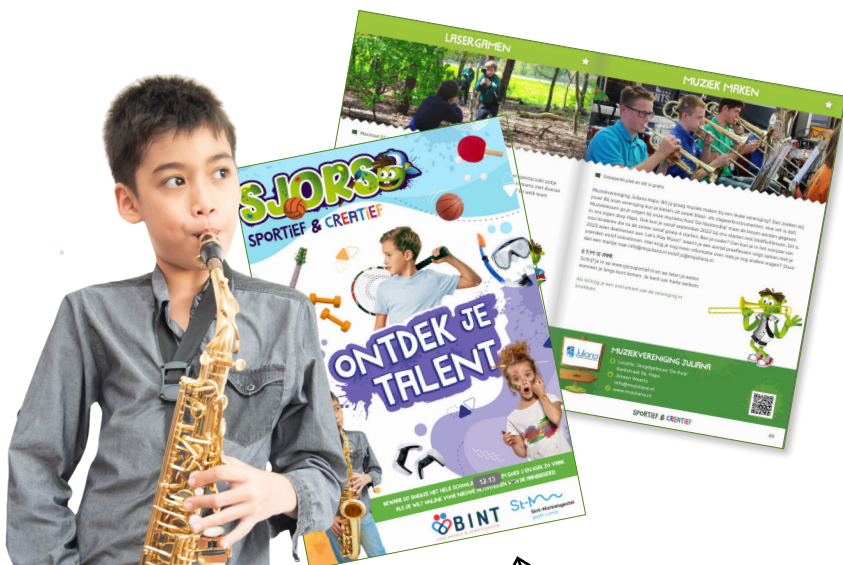
HET SJORSBOEKJE MET JOUW ACTIVITEITEN